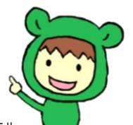
※地域ガエル (PRキャラクター)